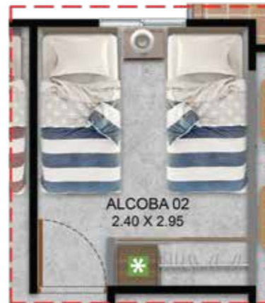
Opción Para Futuro Desarrollo- Estudio